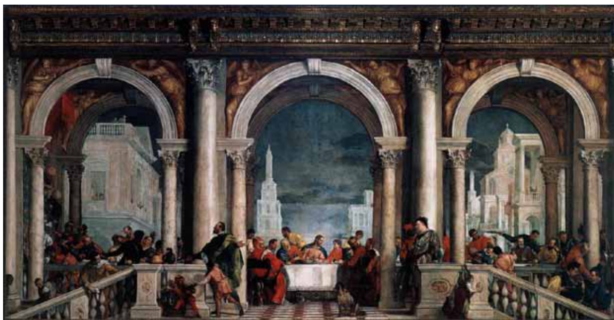
Bild: Paolo Veronese, Das Festmahl bei Levi.