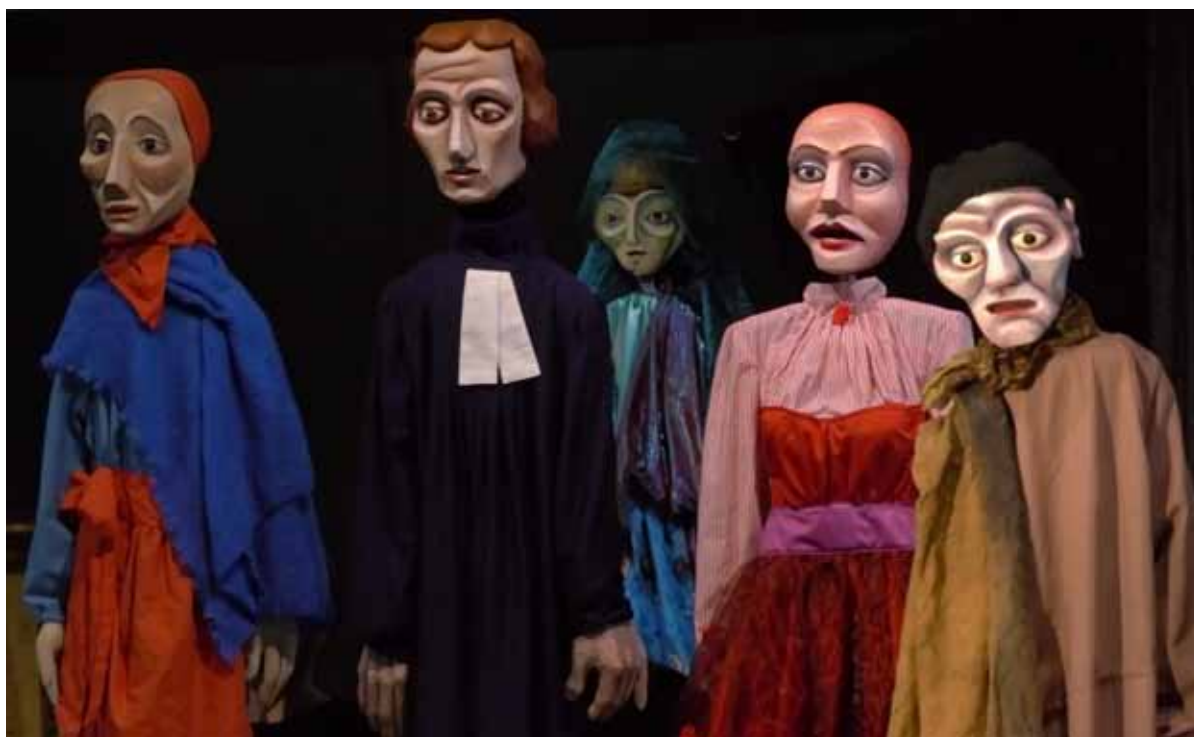
Die lebensgrossen Holzfiguren bleiben durch ihre ausdrucksstarken Gesichter in Erinnerung.